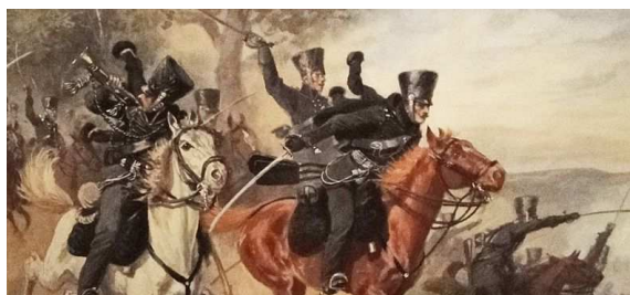
Lützows wilde verwegene Jagd