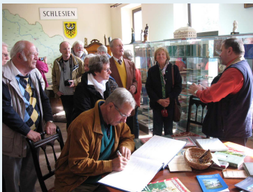
Studiengruppe der OMV OH im Eichendorff-Zentrum in Lubowitz im Sept. 2012

Museum der Stadt Bad Schwartau, Anton-Baumann-Str. 5