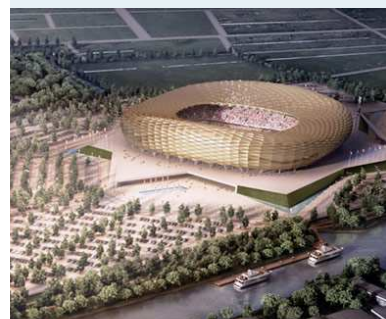
FIFA WM™ Stadion Königsberg