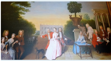
Gräfl. Fam. Bothmer