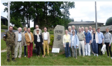
Besuch in der BW Radarstation Brekendorf am 8.6.2016