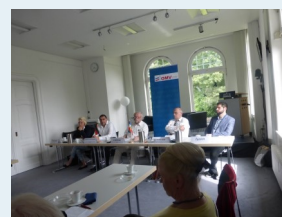
Pod.Disk.ü. Flüchtlingssituation in SH am 9.7.2016 HEA Villa Kiel

Spendenkonto der L-OMV S-H Bordesholmer Sparkasse IBAN: DE16210512750010015588