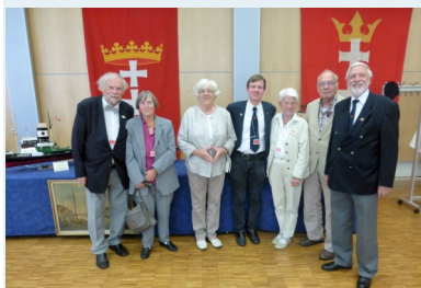
"Tag der Danziger" im Haus d. Handwerkskammer HL am 3.9.2016