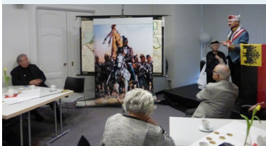
Pr. Tafelrunde 12.3.2016 HEA/Villa, Kiel