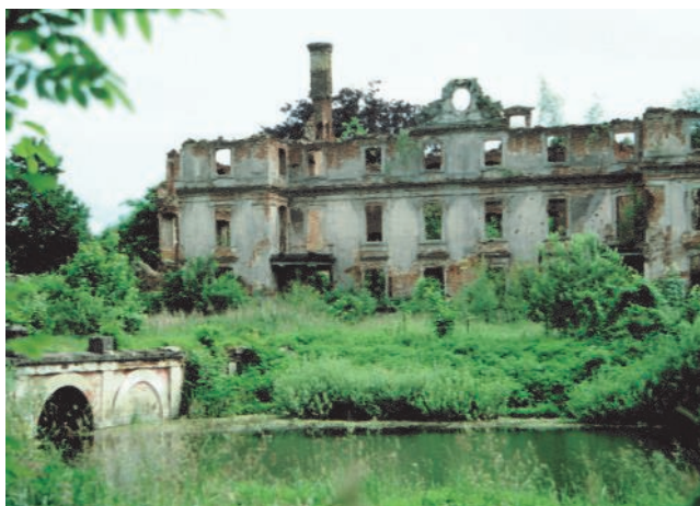
Schloss Schlobitten nach 1945 (Blick a. d. steinerne Brücke u. Schl. Ruine)

Das Schloss bildete den Abschluss eines riesigen Platzes, der auf allen Seiten von Flügelbauten und Nebengebäuden umschlossen war. Innerhalb des gewaltigen Komplexes befanden sich zwei rechteckig angelegte Schlossteiche mit einer steinernen Brücke, die sich heute in einem katastrophalen Zustand befinden, ein deprimierender Anblick! Die Innenausstattung war von erlesener Qualität, eine Schatzkammer mit angesammelten Kunstwerken aus vergangenen Jahrhunderten, u.a. 450 Gemälde, darunter berühmte holländische Familienporträts aus dem 17. Jahrhundert, prächtiges Mobiliar, Delfter Fayencen, Silber- und Golderzeugnisse, Münzsammlungen und flämische Gobelins. Ferner gab es eine aus 50.000 Bänden bestehende Privatbibliothek, die zu den größten in Europa gehörte. Aus der Familie Dohna sei u.a. Heinrich zu Dohna-Schlobitten (1882-1944), der der Widerstandsbewegung angehörte, zu erwähnen; er wurde vom Volksgerichtshof zum Tode verurteilt und am 14. 9. 1944 in Plötzensee hingerichtet.