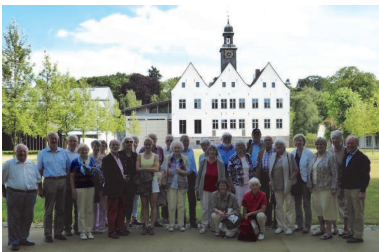
OMV Besuch am 30.6.2015 im Kloster Nütschau/Kr. Stormarn