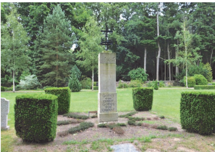
Gedenkstätte 1945 - Demmin

Am 30. April zogen die siegestrunkenen Sowjetsoldaten in die vom Kriege bisher verschonte Stadt ein. Demmin wurde bis zum 3. Mai zum Plündern, Morden und Brandschatzen freigegeben und sie feierten ihren Sieg. Abends wurden die Häuser systematisch mit benzingetränkten Besen von Haus zu Haus angezündet. 80 % wurden zerstört. Gelöscht werden durfte nicht und die Vergewaltigungsorgie begann. Die Kleinstadt war überfüllt mit Flüchtlichen aus den deutschen Ostgebieten. Aufgepeitscht durch den berüchtigten Aufruf "Tötet, tötet! Kein Deutscher ist unschuldig!" an die Rote Armee von Ilja Ehrenburg, Stalins Chefpropagandisten und "Gewaltsam brecht den Rassenstolz der deutschen Frau. Nehmt sie Euch in gerechter Revanche.", befolgte dies die Rote Armee nur zu gerne, legitimiert zu morden, zu plündern und zu vergewaltigen. Nach dem Einfall in Ostpreußen 1944, bestes Negativ-Beispiel ist Nemmers-