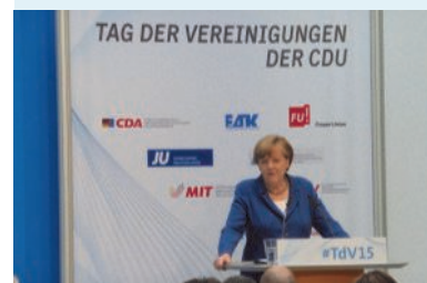
70 Jahre Vereinigungen d. CDU

Spendenkonto der L-OMV S-H Bordesholmer Sparkasse Konto-Nr. 100 155 88 BLZ: 210 512 75